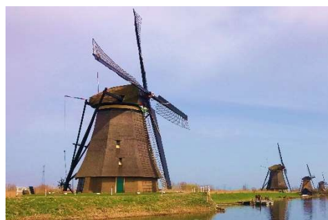
Mill Network at Kinderdijk-Elshout