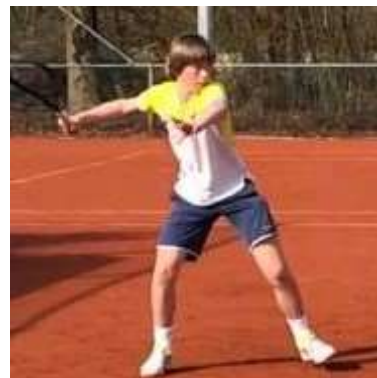
Under16 from Netherlands

種目 18歳以下男子シングルス / 18歳以下女子シングルス ※2004年1月1日以降出生の選手